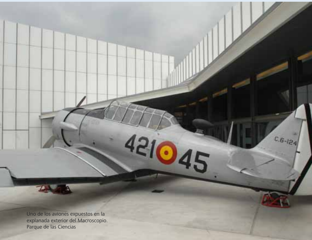
Uno de los aviones expuestos en la explanada exterior del Macroscopio. Parque de las Ciencias